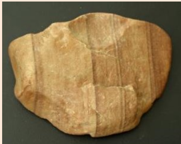
Pískovec – souvky usazené

Nejhojněji jsou u nás zastoupeny souvky a bludné balvany z jihozápadního Finska, Alandských ostrovů, ze dna Botnického zálivu a východního Baltu. Ze švédských oblastí z Dalarna a Smaland a ostrova Bornholm. Norské souvky jsou vzácnější. Pazourky pocházejí z jihozápadního pobřeží Baltu (Dánsko a severního pobřeží Německa), pazourkové hlízky z ostrova Syltu.