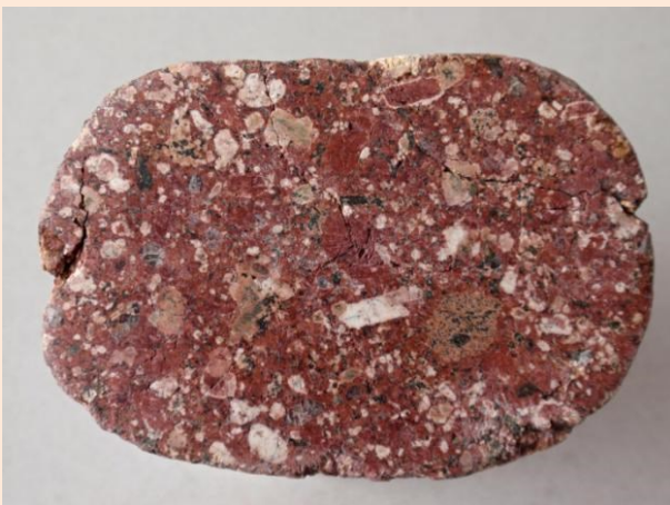
Garberg granit – souvky krystalinické