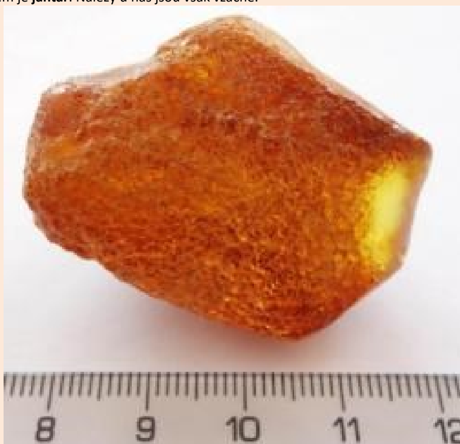
Vzácný souvek jantaru nalezený v roce 2016 v Ostravě - Porubě. rozměry 4 x 2,8 x 1,8 cm

Dalším sedimentem je jantar . Nálezy u nás jsou však vzácné.