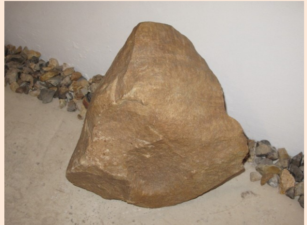
Bludný balvan – pískovec s fosiliemi „ Skolithos linearis “

Velikost bludných balvanů se však s klesající energií ledovce a nadmořskou výškou směrem k jihu zmenšuje. Ve Slezsku nejsou vzácné bludné balvany o velikosti 2 – 2,5 metrů. Bludné balvany jsou v kraji nápadné a často se k nim váže nějaká pověst nebo pověra.