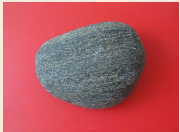
Amfibolit – souvky přeměněné