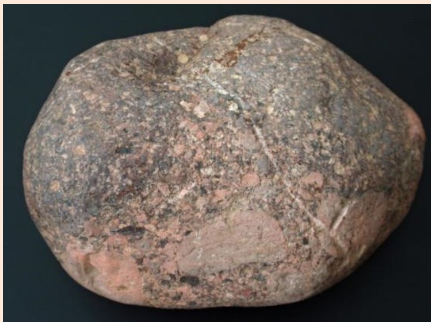
Digerberg konglomerát vůdčí souvek ze středního Švédska

Pazourek je varieta křemene ze slabě zpevněných vápencových sedimentů, jehož hlavní součástí je chalcedon. Vznik pazourku je raně diagenetický a SiO 2 je biogenního původu. Zkameněliny (makro i mikro) jsou zjistitelné v každém pazourku !!!