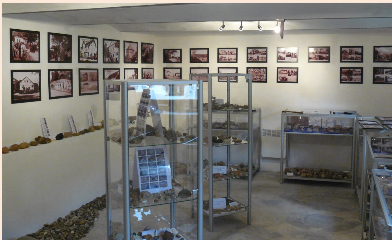
Expozice souvků a pazourků

Zavítali jste do místnosti, která by Vám měla alespoň trošku přiblížit naše nejstarší přírodní ale i kulturní dědictví a památky, které nám na Hlučínsku zanechaly ledovce.